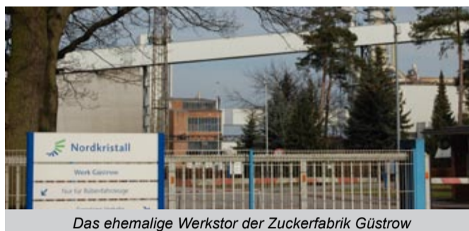
Das ehemalige Werkstor der Zuckerfabrik Güstrow